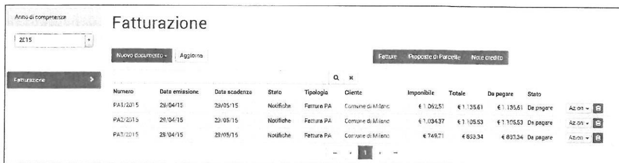
Elenco fatture con evidenziazione arrivo notifiche